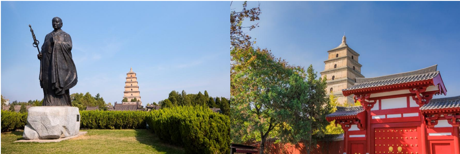
กว่าพันเล่ม

จากนั้นนำท่านเดินทางสู่ เจดีย์ห้าท้าวใหญ่ แห่งวัดฉือเอิน สร้างเสร็จในปีค.ศ. 652 โดย ถังเกาจง(หลี่จื้อ) ย่องเต๋องค์ที่สาม แห่งราชวงศ์ถัง และ ได้นิมนต์พระภิกษุสวนจั้ง หรือรู้จักในนามพระถังซัมจั๋ง พระเถระที่มีชื่อเสียงที่สุดในสมัยถัง ซึ่งใช้เวลากว่า 15 ปีจาริกไปถึงอินเดียและได้นำพระธรรมคำสั่งสอนในพระพุทธศาสนา กลับมาเผยแผ่ในแผ่นดินจีนให้มาอยู่ที่วัดฉือเอินแห่งนี้พระถังซัมจั๋งได้ใช้เวลาออกแบบและร่วมสร้างเจดีย์ห้าท้าวใหญ่ในวัดฉือเอินเพื่อใช้ในการเก็บรักษาพระไตรปิฎก ที่ท่านได้นำมาจากอินเดียและแปลเป็นภาษาจีนนับจำนวน