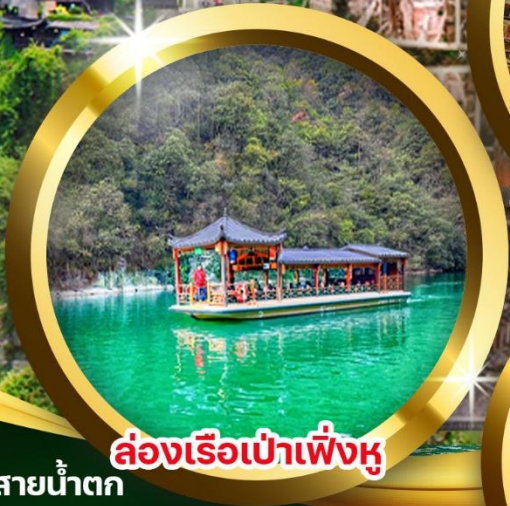
ล่องเรือเป่าเฟิ่งหู