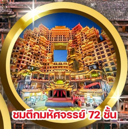
ชมตึกมหัศจรรย์ 72 ชั้น