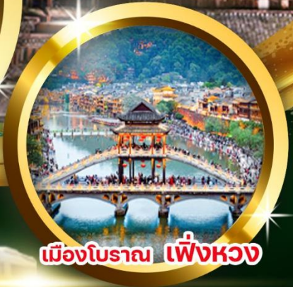
เมืองโบราณ เฟิ่งหวง