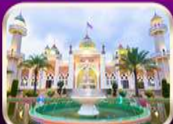
ชมมัสยิดกลางปัตตานี