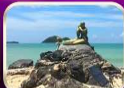
เที่ยวหาดสมิหลา สงขลา