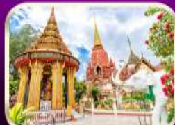
หอพระหลวงปู่ทวด วัดช้างให้