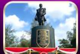
อนุสาวรีย์กรมหลวงชุมพรฯ