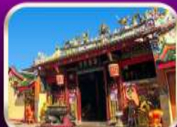
ศาลเจ้าแม่ลิ้มกอเหนี่ยว

ที่เที่ยวเพิ่มขึ้น และ ช่วยฟื้นฟูเศรษฐกิจภาคใหญ่