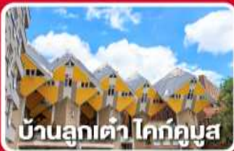
บ้านลูกเต่า ไคท์คูบัส