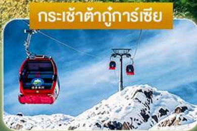
กระเช้าต้ากู่การ์เซีย