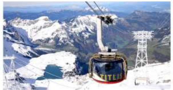
Highlight ! กระเช้าโรแตรเป็นกระเช้าไฟฟ้าหมุนได้ 360 องศา แห่งแรกของโลก จุผู้โดยสารได้ 80 คน ใช้เวลาประมาณ 5 นาที ในการขึ้นสู่ยอดเขา

จากนั้นนำท่านเดินทางสู่ เมืองแองเกิลเบิร์ก (Engelberg) (ระยะทาง 36ก.ม. / 1ชม.) หมู่บ้านเล็กๆ ตั้งอยู่เชิงเขา ที่ล้อมด้วยเทือกเขาแอลป์ เป็นที่ตั้งของ สถานีขึ้นคิตลิส จากนั้นนำท่านนั่งกระเช้าโรแตรเพื่อเดินทางขึ้นสู่ ยอดเขาคิตลิส (Titlis) (ค่าขึ้นกระเช้าไป-กลับ รวมในค่าทัวร์แล้ว) ให้ท่านจะได้สัมผัสกับกระเช้าทรงกลมที่เรียกว่า โรแตร เคเบิลคาร์ ในขณะที่เคลื่อนที่ขึ้นไปเรื่อยๆ ท่านจะเห็น เทือกเขาแอลป์ ธารน้ำแข็ง และทะเลสาบเบื้องล่าง ในวันที่อากาศแจ่มใส คุณสามารถมองเห็นยอดเขา Jungfraujoch และ Eiger ได้อีกด้วย ชม ถ้ำน้ำแข็ง (Glacier cave) ที่สวยงามและเดินเล่นถ่ายรูปหรือเล่นหิมะบนยอดเขา และ ชม สะพานแขวน (TITLIS CLIFF WALK) สร้างขึ้นฉลองครบรอบ 100 ปีการก่อตั้งขบวนยอดเขาคิตลิส สะพานมีความยาว 100 เมตร ความสูง3,000 เมตร ทอดข้ามหน้าผา อีสรให้ท่านถ่ายรูปตามอริยาศัย