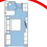
CATEGORY C Balcony Stateroom (57) app. 22 sqm, incl. Balcony