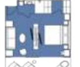
CATEGORY A Junior Suite (4) 40 sqm, incl. Balcony