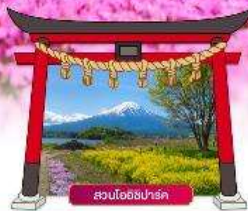
สวนโออิชิปาร์ค