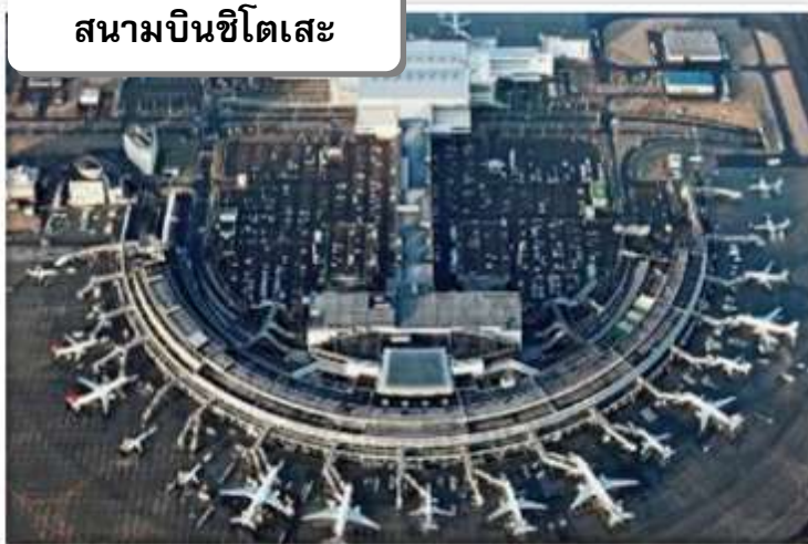
สนามบินชิตเสะ