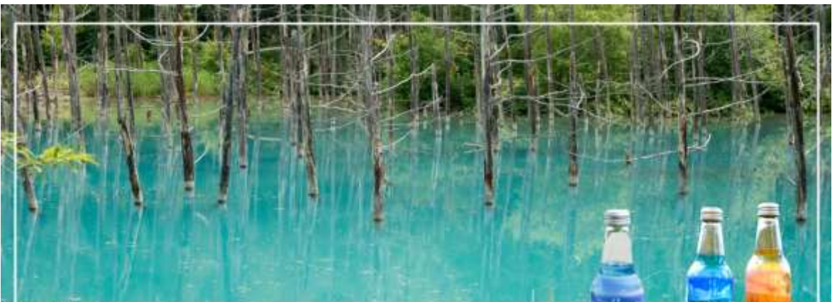
BLUE POND สระอะโออิเคะ

จากนั้นนำท่านชม สระอะโออิเคะ (Aoiike) หรือที่เราจะรู้จักกันอีกชื่อหนึ่งว่า "สระน้ำสีฟ้า (Blue Pond)" ห่างจากเทือกเขา Tokachi ประมาณ 2.5 กิโลเมตร นับเป็นแหล่งท่องเที่ยวที่เหมาะกับนักท่องเที่ยวสายสงบส่วนมากคนที่จะมาเที่ยวก็จะเป็นนักท่องเที่ยวต่างชาติ สาเหตุที่มีชื่อว่า สระอะโออิเคะ (Aoiike) หรือสระน้ำสีฟ้า (Blue Pond) นั้นก็เพราะว่ามีการตั้งชื่อตามสีของน้ำที่เกิดจากแร่ธาตุตามธรรมชาตินั่นเองโดยน้ำในส่วนนี้เพิ่งเกิดขึ้นจากการกันเขื่อนเพื่อป้องกันไม่ให้โคลนภูเขาไฟ Tokachi ที่ปะทุขึ้นเมื่อปี ค.ศ. 1988 ที่ได้ไหลทะลักเข้าสู่เมืองนั่นเอง