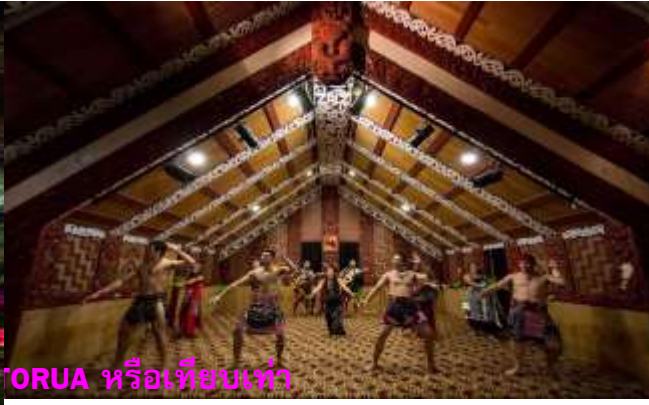
ORUA หรือเทียบเท่า

วันที่สี่ (วันที่ 22 ตุลาคม 2567) โรโตรัว – สวนสัตว์ธรรมชาติ Paradise Valley Springs – ถ้ำนอน เรื่องแสง – อ็อคแลนด์ –สกายทาวเวอร์ พร้อมทางอาหารและชมวิวของเมืองอ็อคแลนด์