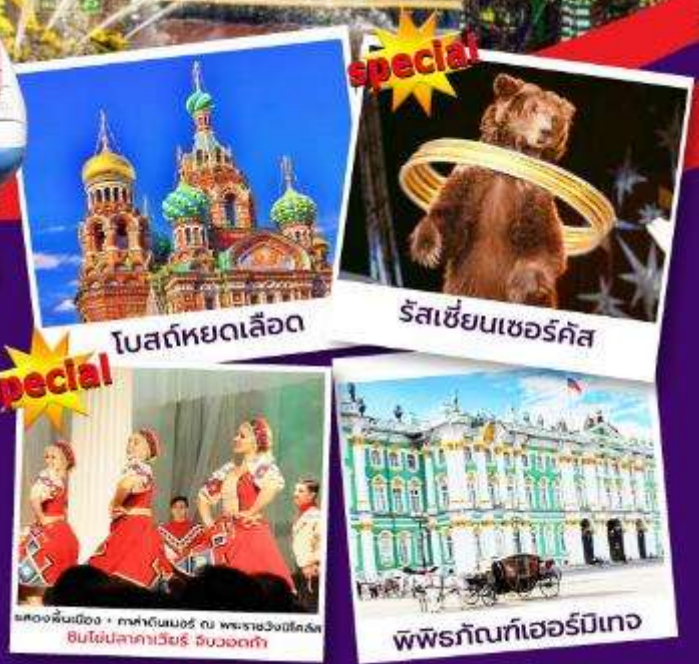
โบสถ์หยดเลือด