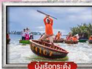
นั่งเรือกระดัง