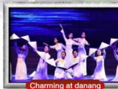
Charming at danang