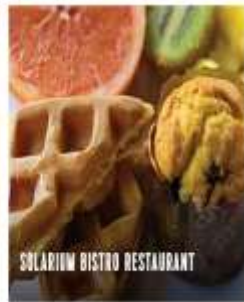
SOLARIUM BISTRO RESTAURANT