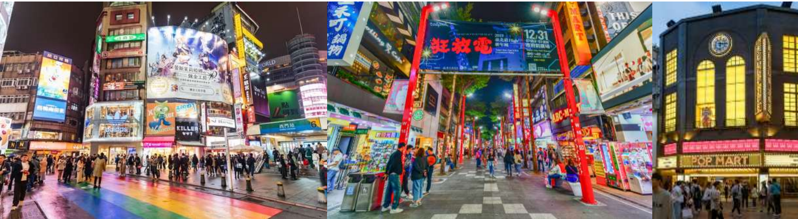
นำทุกท่านเข้าสู่ที่พัก XIEMEN RELITE HOTEL ,เมืองไทเป ระดับ 3 ดาวหรือเทียบเท่าระดับเดียวกัน

จากนั้นนำท่านเดินไปย่านช้อปปิ้ง ซีเหมินติง (XIMENDING) เป็นย่านช้อปปิ้งที่มีชื่อเสียงมากที่สุดของใต้หวัน มีฉายาว่า ฮาราจูกุแห่งไทเป เป็นแหล่งที่รวบรวมสินค้าแฟชั่นต่าง ๆ มากมายหลายแบรนด์ และยังศูนย์รวมความบันเทิงขนาดใหญ่ นอกเหนือจากสินค้าแฟชั่นต่าง ๆ แล้วยังมีร้านอาหารชื่อดังต่าง ๆ หลายร้านเลยทีเดียว เช่น บะหมี่อามอง, ไก่ทอด HOT STAR