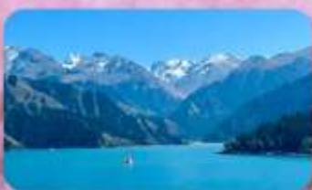
ภูเขาหิมะเงาเทียนชาน