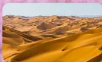
ทะเลทรายคูมู่ต้าเก๋อ