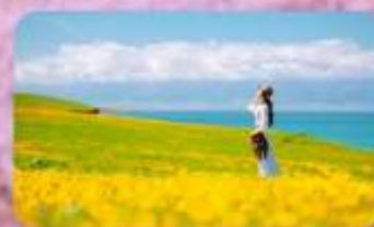
ทะเลสาบไซหลิมู่