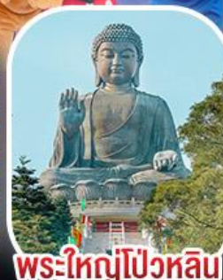
พระใหญ่โป้วหลิน