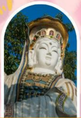
ริพลัสเบย์ รับพลังงานดี เสริมพลังดวงจัญ