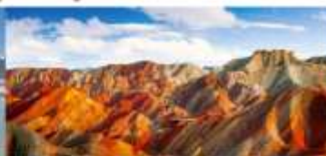
หุบเขาสายรุ้งจางเย่