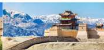
กำแพงเมืองจีน ด่านเจียอวี๋กวน

*ทางบริษัทฯ ขอสงวนสิทธิ์ในการสลับโปรแกรมทัวร์ตามความเหมาะสมขึ้นอยู่กับสถานการณ์หน่วยงาน โดยคำนึงถึงผลประโยชน์ของลูกค้าเป็นสำคัญ