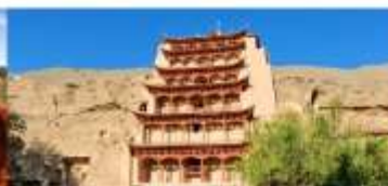
ถ้าแกะสลักม่อเกาคุ