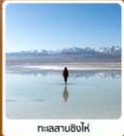
ทะเลสาบชิงไห่