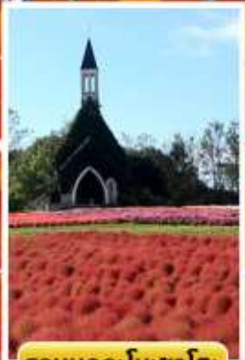
สวนบกกะโนะซาโตะ