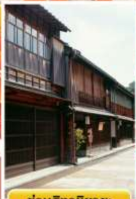
ย่านอิงาชิบายะ