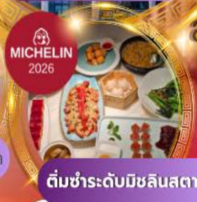
ติ่มซำระดับมิชลินสตาร์

สัมผัสทัศนียภาพเซี่ยงไฮ้ เช็กอินแลนด์มาร์คล้ำยุค ล่องเรือเมืองเก่าจูเจียเจี้ยว พักหรู 5 ดาว ครบจบในทริปเดียว