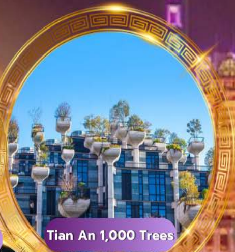
Tian An 1,000 Trees