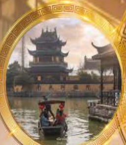
หมู่บ้านโบราณจูเจียเจี้ยว

บินหรู Full service พัก 5 ดาวย่านช้อปปิ้ง