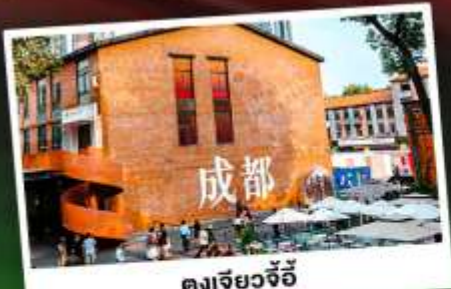
ตงเจียวจี้

เทือกเขาแอลป์แห่งเมืองจีน ชมความงามของ "อุทยานภูเขาสิ่วครุณี"