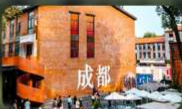
ดงเจียวจี้

HOLIDAY INN EXPRESS HOTEL หรือเทียบเท่า 4 คาว