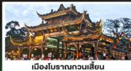
เมืองโบราณทวนเสียน