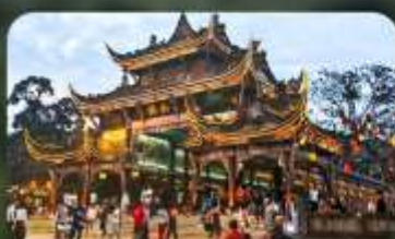
เมืองโบราณกวนเสี้ยน