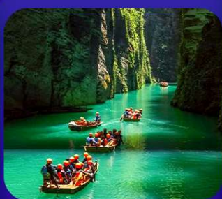
“ ผิงซานแกรนด์แคนย่อน ”

เที่ยวจีน 2 มณฑล เสฉวน+หูเป่ย์ • ถ้าถึงหลง • หุบเขาสิงโต ซื่อจื่อกวน ล่องเรือมังกรกั๋งสูยชมวิวยามค่ำคืน • ผิงซานแกรนด์แคนย่อน (รวมล่องเรือ) หงหยาดัง • จุดชมรถไฟฟ้าทะลุทิว • ตึกตะเทียบ • สือปาตี • หลงเหมินฮ่าว