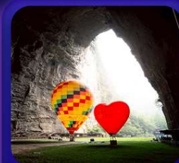
“ ถ้าถึงหลง ”

T2G-CKG29FD ลงชิง เอ็นจีโอ...ถ้าถึงหลง ล่องเรือมังกรกั๋งสูย ผิงซานแกรนด์แคนย่อน 5D 4N (FD)