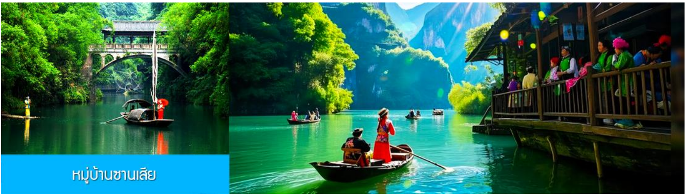
หมู่บ้านชาเลีย