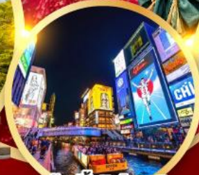
ช้อปปิ้งชินโซบาช