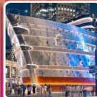
เรือหลุยส์