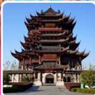
วัดหลงหยวน