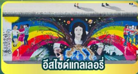
อีสไซด์แกลลอรี่