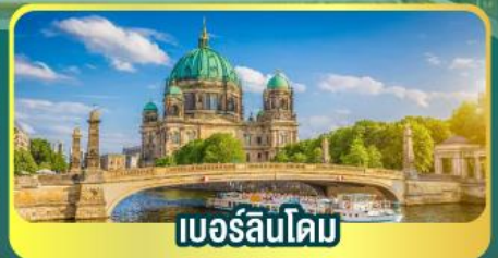
เบอร์ลินโดม