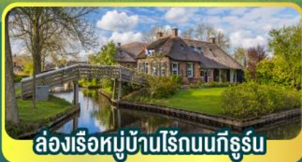
ล่องเรือหมู่บ้านไรน์บนทีกูร์น