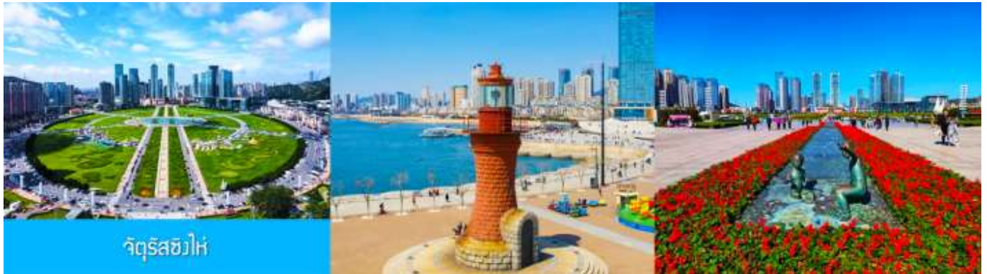
จัตุรัส星海

หลังอาหารนำท่านสู่ สวนเชอร์รี่ 樱桃园现摘樱桃 ให้นำท่านสัมผัสประสบการณ์สุดชิล ด้วยการเด็ดเชอร์รี่สดจากต้นภายในสวนเชอร์รี่ (เชอร์รี่จะของเมืองนี้จะเริ่มสุกและเก็บได้ในช่วงปลายเดือนพฤษภาคม - มิถุนายนของทุกปี ในกรณีที่ผลเชอร์รี่น้อยหรือหมดเร็วกว่าปกติ ทางทัวร์ขอสงวนสิทธิ์ในการจัดโปรแกรมอื่นแทนการเด็ดเชอร์รี่)