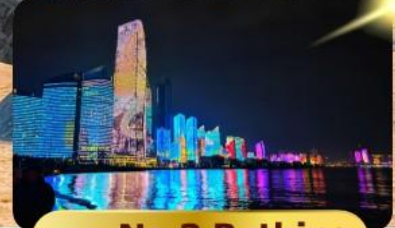
หาด No.3 Bathing

เมนูพิเศษ ซาบูสายพาน 6 วัน 4 คืน เดินทาง : พฤษภาคม 69