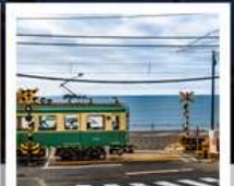
รถไฟเอโนะเด็ตสึ