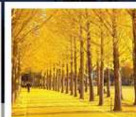
สวนเอ็ทซึโป