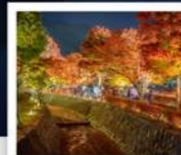
อุโมงค์เมบิล