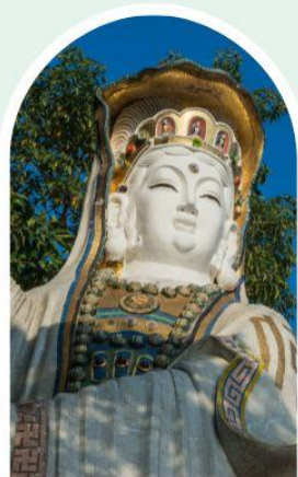
เจ้าแม่กวนอิม ธิพลสัย