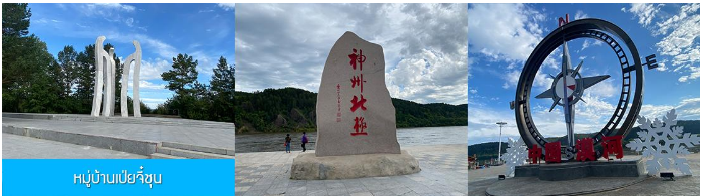
หมู่บ้านเป่ย์จี้ซุน

เที่ยง รับประทานอาหารกลางวัน ณ ร้านอาหารระหว่างทาง (20)