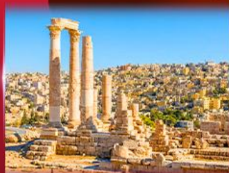
ป้อมปราการอันมาน