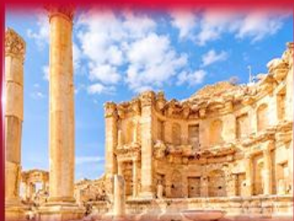
เมืองโบราณเพตรา