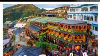
หมู่บ้านโบราณจิ่วเฟิ่น