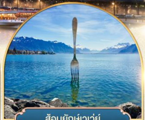
ส้อมยักษ์เวอเวย์