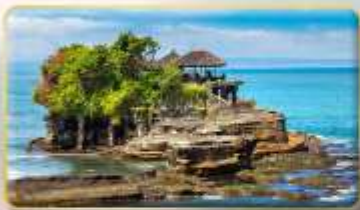
วิหารกานาห์ลือด