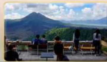
หมู่บ้านคินตามณี