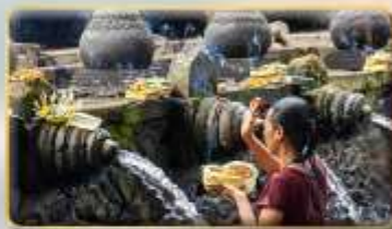
วัดน้ำพุศักดิ์สิทธิ์