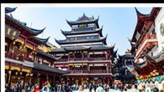
ตลาดร้อยปีเฉิงหวงเมี่ย