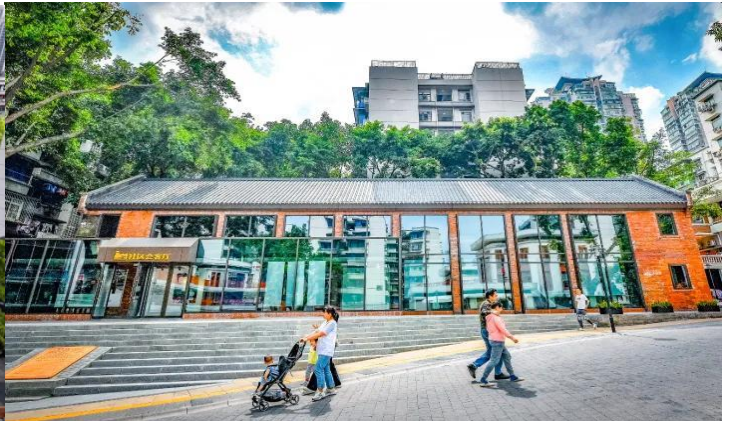
กลางวัน รับประทานอาหารกลางวัน ณ ภัตตาคาร (มือที่ 11)

นำท่านเดินทางสู่ ถนนคนเดินเอ๋อหลิง จากโรงงานพิมพ์ธนบัตร สู่แลนด์มาร์กศิลปะสุดฮิปแห่งฉงชิ่ง ท่ามกลางภูเขา ถนนลาดชัน และตึกสูงอันเป็นเอกลักษณ์ของมหานครฉงชิ่ง มีสถานที่แห่งหนึ่งที่สะท้อนเสน่ห์ของ “เมืองเก่าและเมืองใหม่” ได้อย่างสมบูรณ์แบบ นั่นคือ “TESTBED2” แลนด์มาร์กสายอาร์ตที่กำลังกลายเป็นหัวใจของวัฒนธรรมสร้างสรรค์ในเมืองฉงชิ่ง เดิมทีสถานที่แห่งนี้คือ “โรงพิมพ์ธนบัตรกลาง” ที่ก่อตั้งขึ้นในปี 1937 ในยุคสาธารณรัฐจีน ก่อนจะเปลี่ยนชื่อเป็น โรงพิมพ์หมายเลข 2 ของฉงชิ่งในปี 1953 ซึ่งเคยเป็นศูนย์กลางงานพิมพ์ที่สำคัญที่สุดแห่งหนึ่งของจีนตะวันตกเฉียงใต้ ทั้งธนบัตร แสตมป์ ตั๋ว และเอกสารราชการจำนวนมาก ล้วนเคยถูกผลิตจากที่นี่