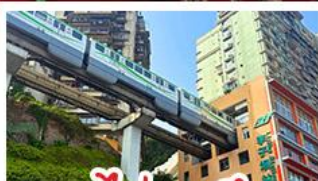
รถไฟทะลุคด