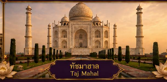
ทัชมาฮาล Taj Mahal