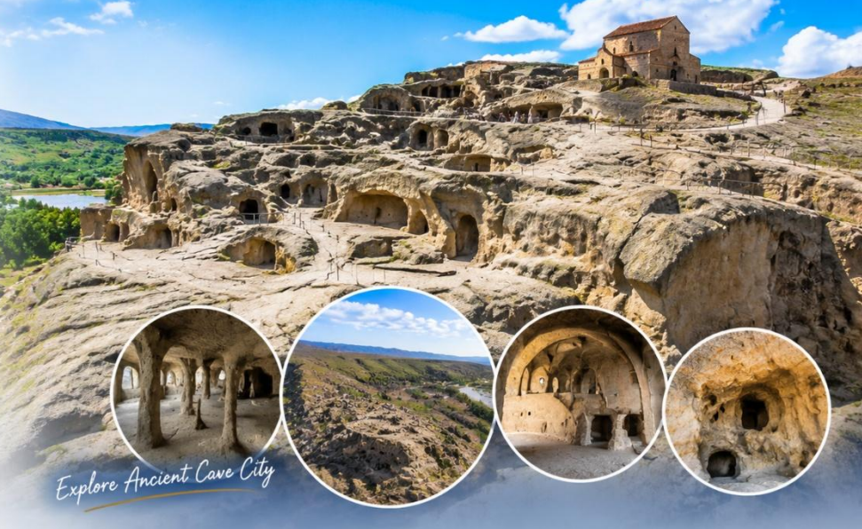
Explore Ancient Cave City

นำท่านเดินทางสู่เมืองคูไตซี (Kutaisi) (ประมาณ 145 กม./1.50ชม.) เมืองนี้มีความเจริญเป็นอันดับสองรองจากทบิลีซี ชมความสวยงามของเมืองคูไตซี ซึ่งมีชื่อเสียงทางด้านวัฒนธรรมและได้รับการขึ้นทะเบียนให้เป็นมรดกโลก ซึ่งถ้าย้อนกลับไปเมื่อสมัยศตวรรษที่ 12-13 ได้เคยเป็นเมืองหลวงเก่าแก่ของอาณาจักรโคลคลิส (Empire of Colchis) และอาณาจักรอิเมรีย (Kingdom of Emetria) ที่อยู่ทางด้านของตะวันตกของประเทศ