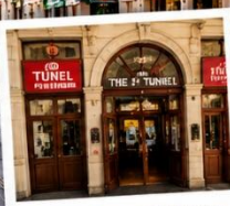
สถานีทูเนล (TUNEL STATION) สถานีรถไฟใต้ดินสายเก่าแก่ และเป็นหนึ่งในระบบขนส่งที่เก่าแก่ที่สุดในโลก