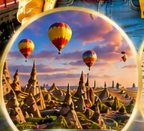
เมืองคัปปาโดเกีย Cappadocia