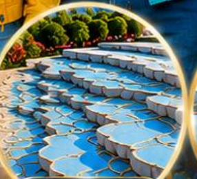
ปามุกคาล่ Pamukkale