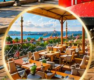
Seven Hills Cafe ชมวิว อิสตันบูล