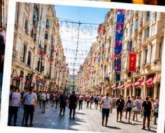
ISTIKLAL STREET (Grand Avenue of Pera) ถนนสายช้อปปิ้ง อิม บิล ครบจบในที่เดียว