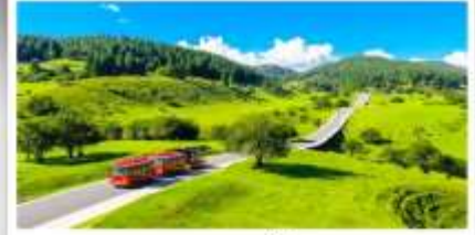
เวนางฟ้า

เดินทางโดย: สายการบินดงซิ่งเจียงเป่ย์ (PN)