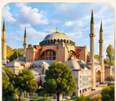
HAGIA SOPHIA โบสถ์เซนต์โซเฟีย