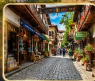
เดินเล่นย่านเมืองเก่าบรรยากาศย้อนยุค