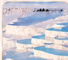
PAMUKKALE ปานุกคาล่า