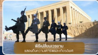
พิธีเปลี่ยนเวรยามแสดงต้นซาดาเนนเคอร์ฟและกีเยสดียัต

ได้เวลาเดินทางทางสู่เมือง "ซาฟรานโบลู" (Safranbolu) คือเมืองท่องเที่ยวที่มีชื่อเสียงของจังหวัดการาบึค (Karabük) ในภูมิภาคทะเลดำตุรกี เป็นเมืองที่มีความสำคัญทางด้านประวัติศาสตร์ของประเทศ ตุรกี โดยเฉพาะชื่อเสียงเกี่ยวกับสถาปัตยกรรมซาฟรานโบลู ที่มีอิทธิพลต่อพัฒนาการชุมชนเมืองทั่วทั้งจักรวรรดิออตโตมัน ต่อมาในปี 1994 เมืองซาฟรานโบลู ได้ถูกองค์การยูเนสโกยกให้เป็นมรดกโลกทางด้านวัฒนธรรม