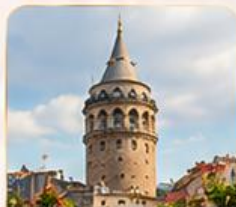
GALATA TOWER หอคอยกาลาตา