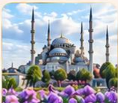
BLUE MOSQUE สุเหร่าสีน้ำเงิน