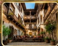
บ้านเรือนสไตล์ออตโตมันอายุกว่า 200 ปี

เมืองท่องเที่ยวที่มีชื่อเสียงของจังหวัดการาบึค (Karabük) ในปี 1994 เมืองซาฟรานโบลู ได้ถูกองค์การยูเนสโกยกให้เป็น มรดกโลกทางด้านวัฒนธรรม