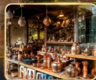
เลือกซื้อของฝากงานหัตถกรรมพื้นเมือง

สัมผัสเสน่ห์แห่งอดีตในเมืองที่เวลาเดินช้าลง กับสถาปัตยกรรมอันงดงาม วัฒนธรรมที่ยังคงมีชีวิต และความอบอุ่นจากผู้คน