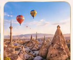
CAPPADOCIA คัปปาโดเกีย