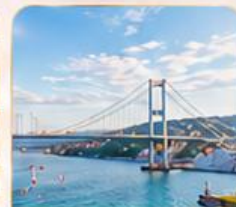
BOSPHORUS STRAIT ช่องแคบบอสฟอรัส