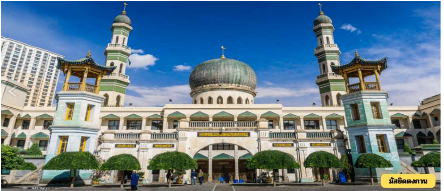
มัสยิดตงกวน

... น. รถไฟถึงสถานีนครซีหนิง เมืองเอกของมณฑลชิงไห่ มณฑลขนาดใหญ่ซึ่งตั้งอยู่บนที่ราบสูงทิเบต-ชิงไห่ ที่มีความสูงเฉลี่ยกว่า 3,000 เมตรจากระดับน้ำทะเล มีประชากรเบาบางเพียงประมาณ 5 ล้านคน ภูมิประเทศเป็นภูเขาและที่ราบสูง เส้นผ่าของชิงไห่คือความรกร้างห่างไกลและความเป็นอยู่ของชนเผ่าเร่ร่อน