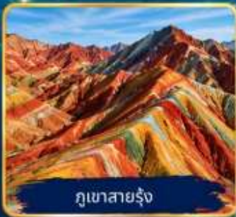
ภูเขาสายรุ้ง