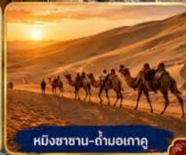
หมีงซาซาน-กำแพงเกาตุ