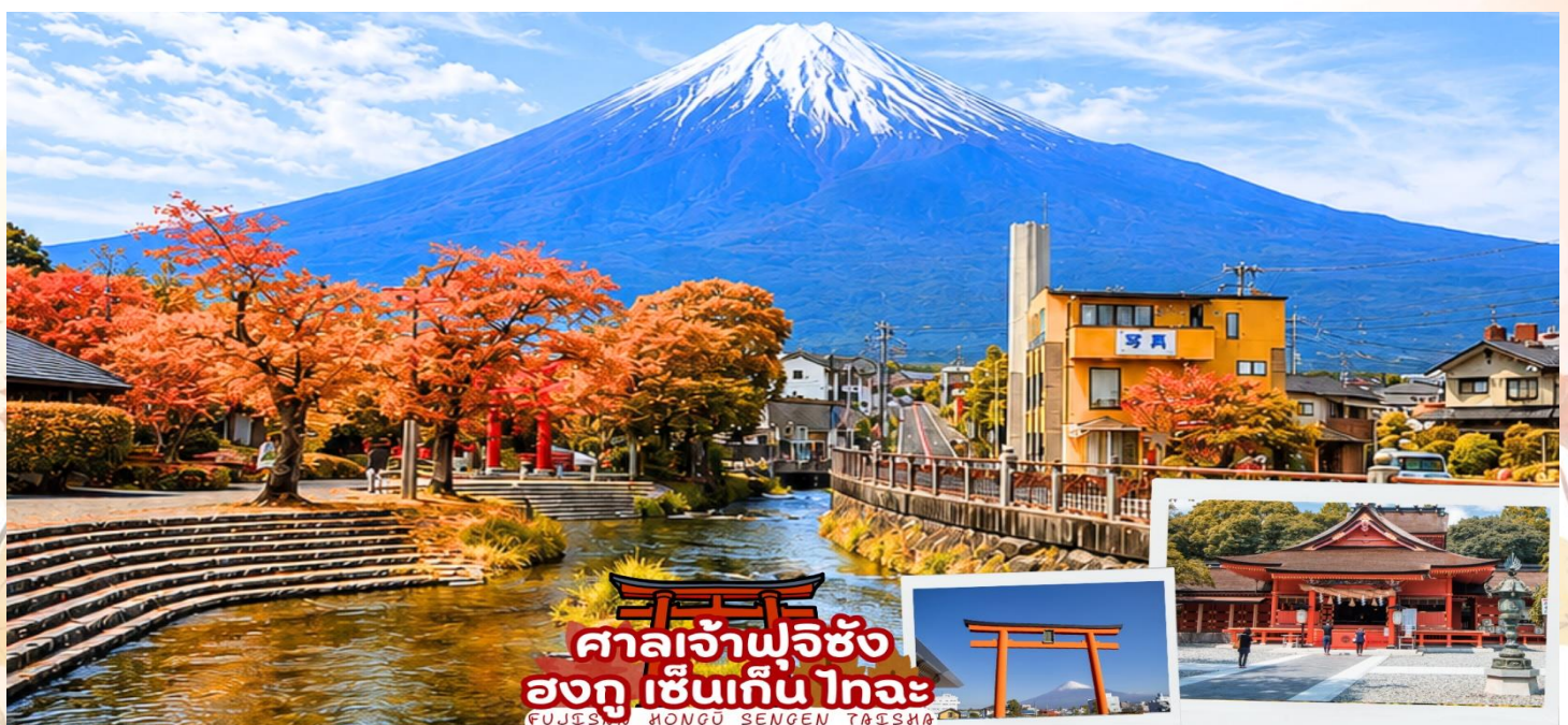
ศาลเจ้าฟูจิซัง ฮงกุ เซ็นเกิน ไทอะ FUJISAN HONGU SENGEN TAISHA

ศาลเจ้าฟูจิซัง ฮงกุ เซ็นเกิน ไทอะ (Fujisan Hongū Sengen Taisha) เป็นศาลเจ้าชินโต ตั้งอยู่ทางทิศตะวันตกเฉียงใต้ของฐานภูเขาไฟฟูจิ ในเมืองฟูจิโนะมิยะ จังหวัดชิซุโอกะ ครอบคลุมตั้งแต่ฐานภูเขาไฟฟูจิ ไปจนถึงยอดภูเขา ภายในศาลเจ้าเต็มไปด้วยความสงบ มีทั้งสถาปัตยกรรมแบบญี่ปุ่นโบราณ บ่อน้ำศักดิ์สิทธิ์ และวิวของภูเขาฟูจิที่งดงาม ศาลเจ้าแห่งนี้ตั้งอยู่ในตำแหน่งที่สามารถมองเห็นวิวภูเขาไฟฟูจิได้อย่างสวยงาม ด้วยบรรยากาศที่เงียบสงบและธรรมชาติรอบข้างสวยงาม ด้านหน้ามีน้ำไหลผ่านพร้อมกับเสาโทริสีแดง และภูเขาฟูจิ ทำให้ที่ศาลเจ้าแห่งนี้เป็นอีกหนึ่งจุดชมวิวภูเขาฟูจิและการถ่ายภาพที่สวยงามมาก