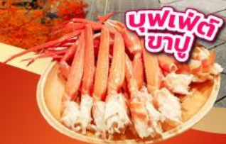
บุฟเฟ่ต์ ภูเขา

เช็किनจุดถ่ายรูป ศาลเจ้าฟูจิซัง ฮ่องกงเซ็นเทินไทยะ