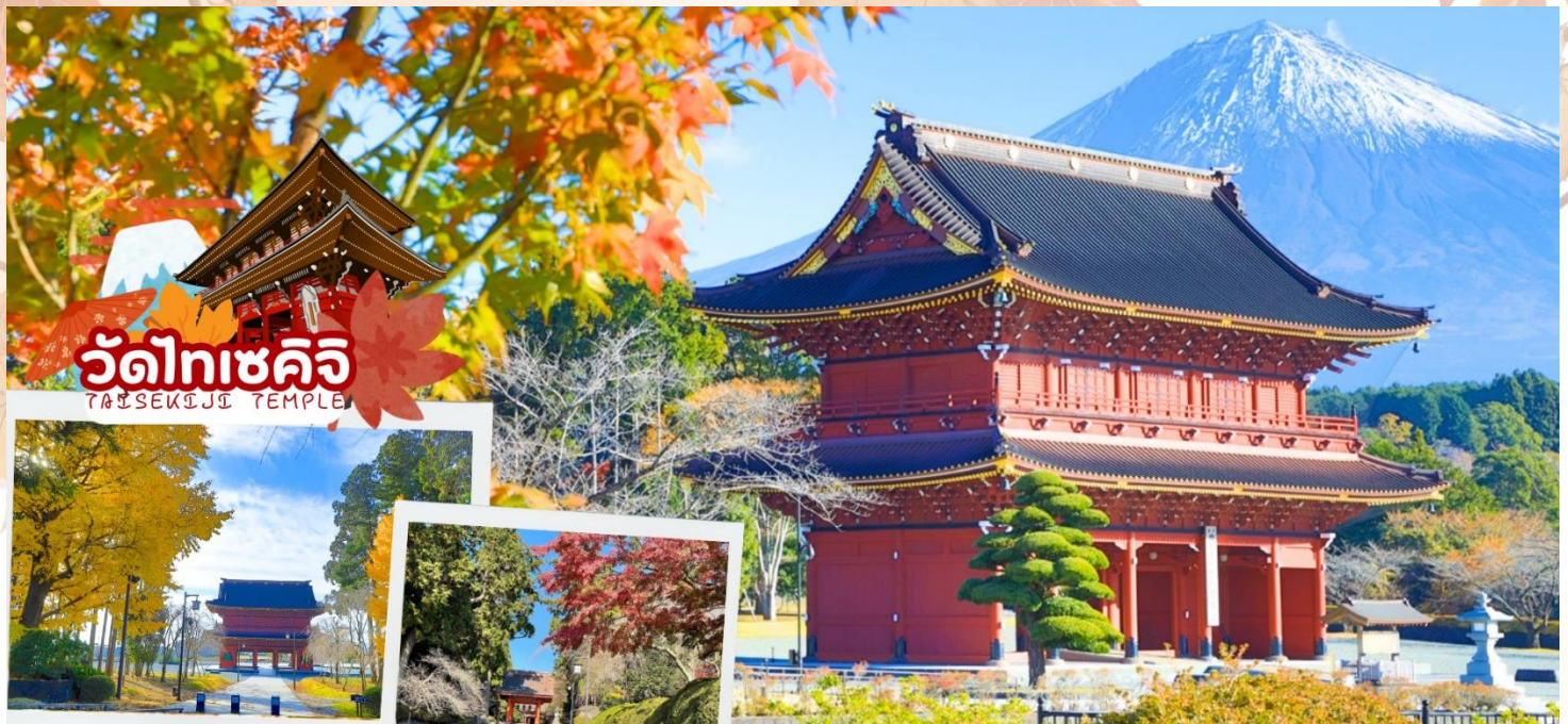
วัดไทเซคิจิ TAISEKIJJI TEMPLE

กลางวัน รับประทานอาหารกลางวัน ณ ร้านอาหาร (มื้อที่ 3)