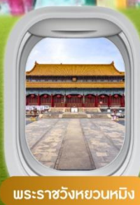
พระราชวังหยวนหมิง