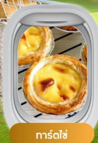
ทาร์ตไข่