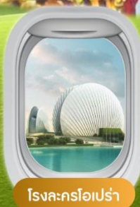
โรงละครโอเปร่า