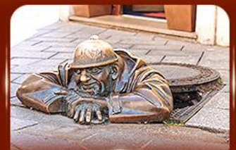
แลนด์มาร์คดัง รูปปั้นคูมิล ปรากติสลาวา