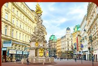
คาร์ทเนอวี สตรีท ออสเตรีย