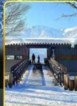
ฮาคุบะอิวาตาคะ