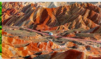
ภูเขาสายรุ้งจางเย่ต้นเสี่ย