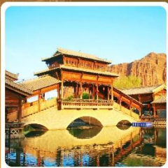
เมืองเล็กตันเสี่ยโซ่ว