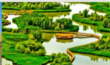
อุทยานพื้นที่ชุ่มน้ำจางเย่