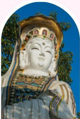
ริฟลิสเบย์ รับพลังงานดี เสริมพลังอวงจู้ย