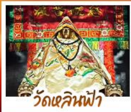
วัดเลิหนี่ฟ้า