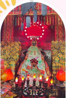
วัดเจ้าแม่กวนอิมอ่องอ่า ขอพรเรื่องเงิน ทรัพย์สิน และความมั่งคั่ง