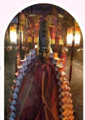
วัดหลินฟ้า โชคลากและความมั่งคั่ง