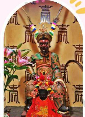
วัดเซกกองเก่าแก่ 400 ปี ไซกง