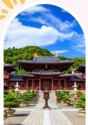
วัดนางชีฉีหลิน สวนหนานเหลียน