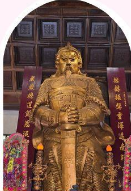
วัดเซก ซาถึน ขอพรโชคลาก การเงิน และธุรกิจ