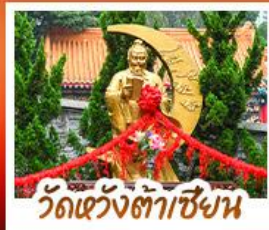
วัดเจ้าเง็กต้าซึ้ง

ขอพรเซงครบทั้ง 3 องค์ เรื่องโชคลาภ การเงินและธุรกิจ • นั่งกระเช้าแองปิง สักการะพระใหญ่เทียนถาน • เจ้าแม่กวนอิมฮ่องฮ่า ขอเรื่องเงิน ทรัพย์สิน ความมั่นคงเจ้าแม่กวนอิมทะเล ขอพรเรื่องความสำเร็จ โชคเปิดเป้าสิ่งไม่ฝัน พิพิธภัณฑ์ 4 ดาว แหล่งช้อปปิ้ง...ย่านจิมซาจุ่ยหรือย่านมงก๊ก