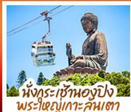
นั่งกระเช้าแองปิง พระใหญ่เกาะคัมตา