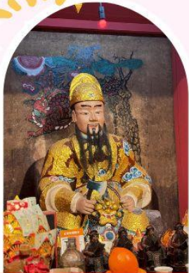
วัดเซกกองเก่าแก่ 600 ปี หยุนหลง

"ไหว้พระ เสริมดวง เพิ่มสิริมงคลแก่ชีวิต"