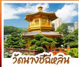
วัดนางชีฉีฉิน